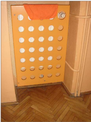
ISTNIEJĄCA OSŁONA W TYM PRZEDSZKOLU